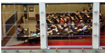
Catedràtic i ex-Degà de Filosofia a la UB