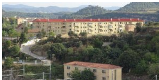
El Punt Avui - Manresa preveu enderrocar la Guia en un màxim de dotze anys