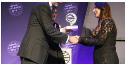
El Punt Avui - Negre amb tonalitats