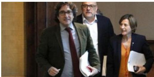
El Punt Avui - Madrigal margina el fiscal de Catalunya en el cas Forcadell