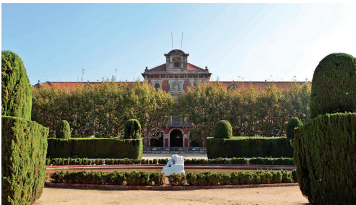
Era sedença deth Parlament de Catalonha

Las salas de comisiones son de dimensiones más reducidas que el Salón de Sesiones; algunas tienen la disposición de los asientos parecida a la del Salón de Sesiones y otras disponen de una única mesa cuadrangular.