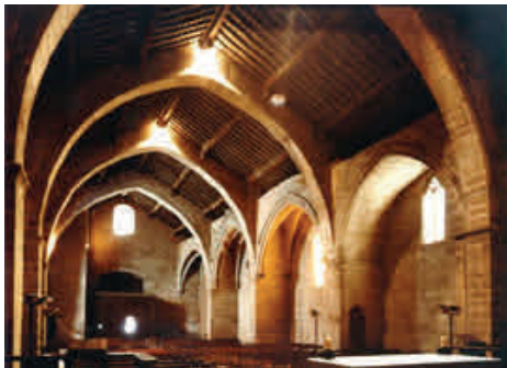
Interior dera glèisa de Sant Miquèu, de Montblanc, a on s'amassèren es Corts diuèrsi viatges pendent eth sègle XIV e un viatge en sègle XV.