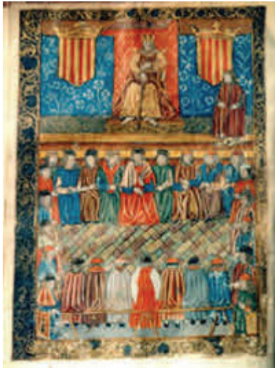
Bois que represente eth rei Jaime I eth Conqueridor (1208-1276) en tot presidir ua session des Corts. (Incunable des Constitucions de Catalonha. Archiu dera Corona d'Aragon, Barcelona.)