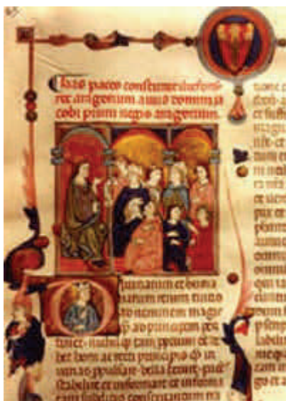
Miniatura que represente eth rei Alfons I eth Cast (1154-1196), en tot presidir ua assemblada de patz e trèva (Còdex des Usatges, Archiu dera Paeria, Lleida.)