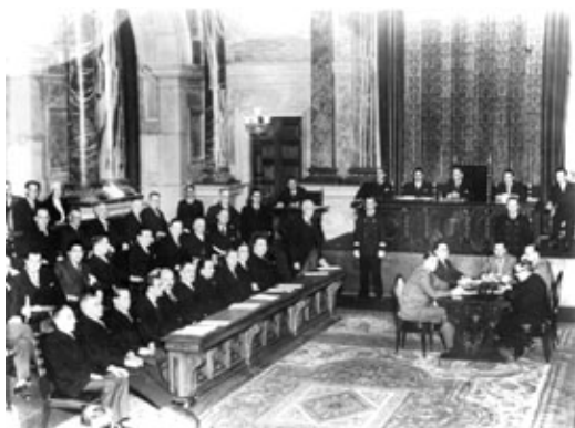
Fotografia dera session inauguraudeth Parlament de Catalonha, celebrada eth dia 6 de deseme de 1932. Ara presidència, eth P. Auble. Sr. Lluís Companys; dret, en banc deth Govèrn, eth president dera Generalitat, P. Auble Sr. Francesc Macià.