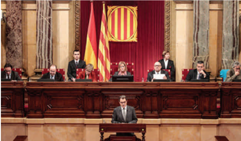
Fotografía del hemiciclo.