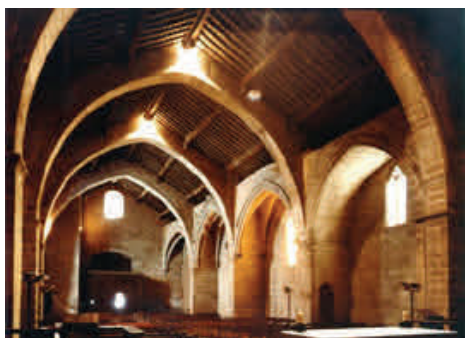
Interior de la iglesia de Sant Miquel, de Montblanc, donde se reunieron las Cortes varias veces durante el siglo XIV y una vez en el siglo XV.