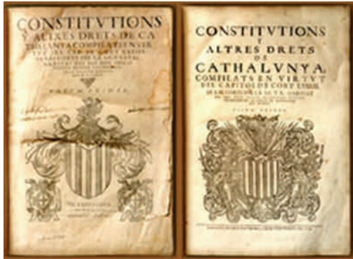
El derecho catalán fue objeto de sucesivas compilaciones oficiales acordadas por las Cortes. Portadas de las compilaciones editadas en 1588 (izquierda) y en 1704 (derecha), que fue la última.