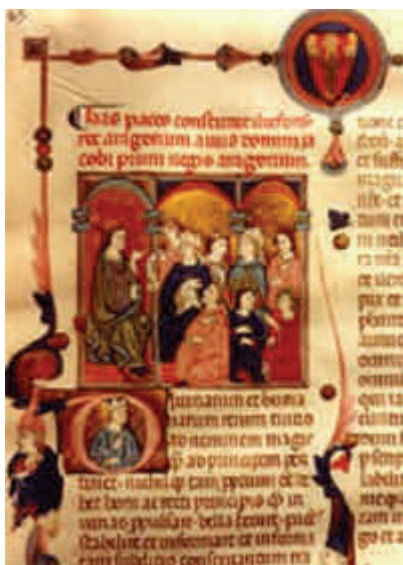
Miniatura que representa al rey Alfonso I el Casto (1154-1196), presidiendo una asamblea de paz y tregua (Códice de los Usatges, Archivo de la Paeria, Lleida.)