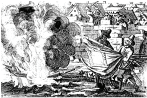
Grabado de época que representa a las tropas vencedoras quemando las banderas de la Generalidad, tras la ocupación de Barcelona en 1714. (Museo de Historia de la Ciudad, Barcelona.)

das para cada brazo, con compromisarios entre los brazos y el rey, denominados tractadors, para consensuar los acuerdos, que se leían y votaban en sesión plenaria. En sesión plenaria final el rey sancionaba solemnemente los acuerdos adoptados. Una convocatoria de Cortes podía durar semanas o meses, e incluso a veces más de un año, con interrupciones más o menos largas.