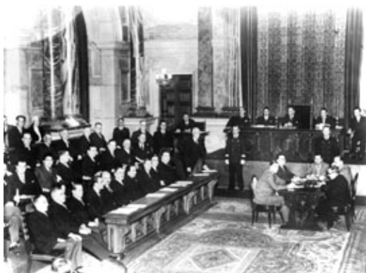
Fotografía de la sesión inaugural del Parlamento de Cataluña, celebrada el día 6 de diciembre de 1932. En la presidencia, el M. H. Sr. Lluís Companys; de pie, en el banco del Gobierno, el presidente de la Generalidad, M. H. Sr. Francesc Macià.