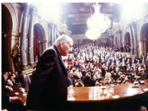
Fotografía de la sesión inaugural del Parlamento restablecido, celebrada el día 10 de abril de 1980. Entrada del presidente de la Generalidad provisional, M. H. Sr. Josep Tarradellas, para presidir el acto.

Desde entonces el pueblo catalán ha aspirado a recuperar las libertades perdidas. La Mancomunidad de Cataluña (1914-1925) constituyó un primer paso institucional en la recuperación del autogobierno, pero fue abolida por la dictadura de Primo de Rivera. Caída la dictadura, se proclamó la Segunda República Española. Se constituyó un gobierno catalán provisional (1931) que tomó el nombre de Generalitat de Catalunya, en recuerdo de la antigua institución de autogobierno. Plebiscitado por la gran mayoría del pueblo catalán en 1931, el Estatuto de autonomía, que legitimaba y organizaba el autogobierno catalán, fue aprobado por las Cortes de la República en 1932. Este autogobierno se institucionalizaba, con el nombre definitivo de Generalitat de Catalunya, en un poder legislativo (denominado Parlamento de Cataluña), un poder ejecutivo (integrado por la Presidencia de la Generalidad, que la representaba al más alto nivel, y el Consejo Ejecutivo) y un poder judicial (que culminaba en el Tribunal de Casación).