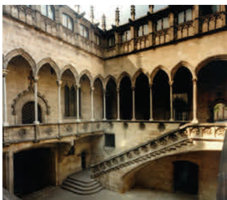
Patio central de la sede de la Diputació del General o Generalidad en Barcelona, palacio construido entre los años 1432 y 1439 por el maestro Lluís Safont. Es también la sede de la Presidencia y el Gobierno de la Generalidad instituida en 1932 y restablecida en 1977.

Durante el reinado de Jaime I el Conquistador (1213-1276), la Corte condal se transformó en Cortes Generales de Cataluña al ampliar progresivamente el número de miembros convocados y, sobre todo, al consolidarse la incorporación del estamento burgués, representado por los prohombres de villas y ciudades. Pero el paso decisivo se dio en el reinado de su hijo, Pedro II el Grande (1276-1285), cuando, en las Cortes de Barcelona de 1283, mediante la constitución Volem, estatuim, se estableció el sistema de soberanía pactada, característico del derecho constitucional catalán medieval y moderno. Según este sistema, solo eran válidas las normas emanadas de las Cortes por acuerdo entre el soberano y los estamentos de la tierra, fuesen a iniciativa del primero (constitucions) o de los segundos (capítols de cort). También debían ser sancionadas por las Cortes las disposiciones promulgadas por el rey en el intervalo en que las Cortes no estaban reunidas (actes de cort, privilegis, pragmàtiques y otros derechos). De hecho, el rey renunciaba a ser el poder legislador exclusivo.