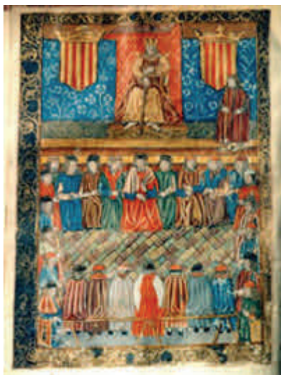
Boj que representa al rey Jaime I el Conquistador (1208-1276) presidiendo una sesión de las Cortes. (Incunable de las Constituciones de Cataluña. Archivo de la Corona de Aragón, Barcelona.)