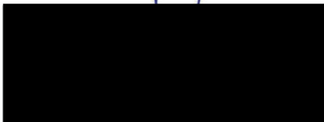
Rafel Luna i Vivas