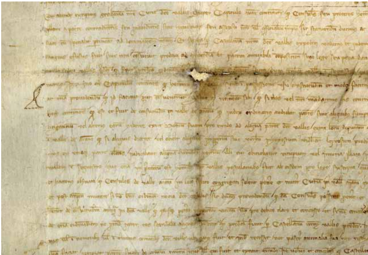
A l'agost del 1313 els magistrats i el Conselh Generau dera Val van ser rebuts pel rei Jaume II al castell de la Suda de Lleida. Allà, en virtut del privilegi solemne anomenat Era Querimònia, els va confirmar la lliure i franca possessió de les seves muntanyes, sense cap servitud reial.

casa es reunien en el Conselh dera Vila per a tractar dels afers comuns i elegir els seus representants, anomenats cònsols . Al seu torn, els pobles s'ajuntaren en unes circumscripcions més àmplies, anomenades terçons (fins al segle xv hi hagué tres terçons a la vall, i, d'aleshores ençà, sis: Pujòlo, Arties e Garòs, Castièro, Marcatoza, Lairissa i Quate-Lòcs). A cada terçon els representants dels pobles elegien un conselhèr per tal de representar-los en les reunions del Conselh Generau dera Val, la més alta institució de govern, administració i representació de la comunitat aranesa. Des de 1616, aquest òrgan estaria integrat per tretze membres: sis conselhèrs , sis proðms i un sindic generau , tots ells elegits per sorteig, pel sistema de la insaculació. Les competències del Sindic i del Conselh Generau abastaven la regulació de tots els àmbits de la vida de la comunitat aranesa, però la seva principal funció era la representació externa de la vall i la defensa dels privilegis i llibertats aranesos.