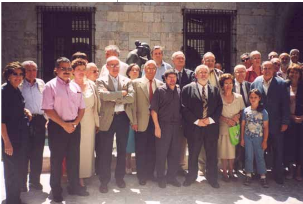
Imatge de la sortida a Perpinyà el 7 de juny de 2003

Sortida de l'autocar de Perpinyà a les 18 h per arribar a Barcelona a les 21 h.