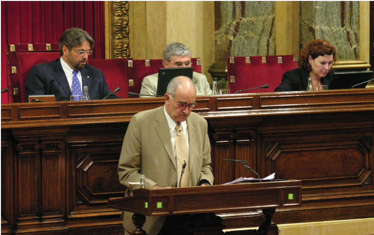
El síndic major en la primera compareixença davant del Ple del Parlament, per presentar l'informe del Compte general de la Generalitat de Catalunya relatiu a l'exercici 2003.