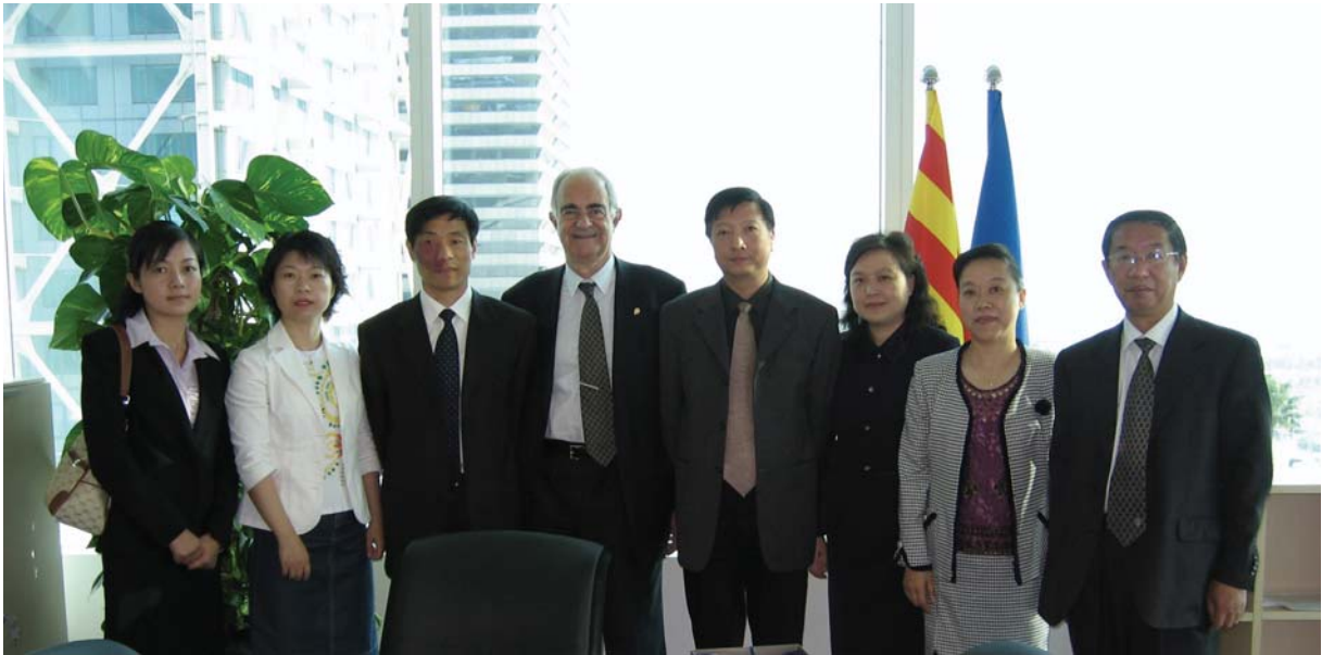
Visita d'una delegació de l'Oficina de Fiscalització del Municipi de Xangai a la Sindicatura.