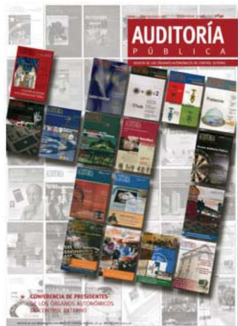
Revista Auditoria pública , núm. 40.

Per altra banda, la Sindicatura continua editant, juntament amb els altres òrgans de control extern autonòmics (OCEX), la revista Auditoria pública , que comprèn un ampli ventall de temes de gestió i control de l'Administració pública, així com de notícies dels mateixos OCEX. Aquesta revista, a més de ser objecte d'una distribució institucional, es ven per correu i per subscripció. També es pot consultar per Internet. Durant l'any 2006 se n'han editat els números 38, 39 i 40.