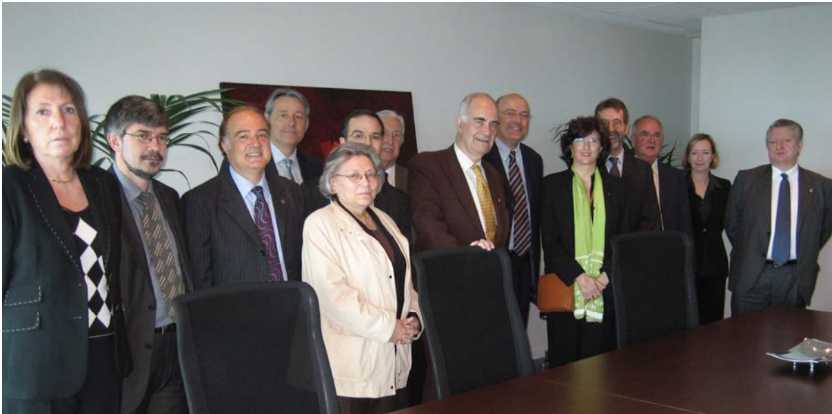
Visita de membres de la Comissió parlamentària de la Sindicatura de Comptes a la seu de la Sindicatura.