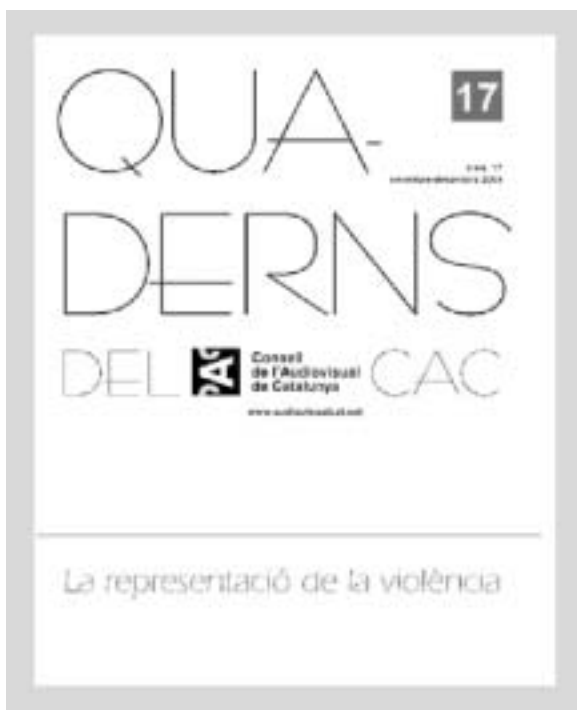
Quaderns del CAC, núm. 17

Al llarg del 2004, es van editar números ordinaris sobre la representació de la violència en els mitjans audiovisuals, la transformació de la ràdio davant la digitalització i sobre el tractament informatiu i la construcció televisiva dels fets de l'11-M i els esdeveniments posteriors fins al 14-M. Així mateix, i seguint la tendència dels anys anteriors, va editar-se com a número extraordinari l'Informe de l'Audiovisual a Catalunya 2003.