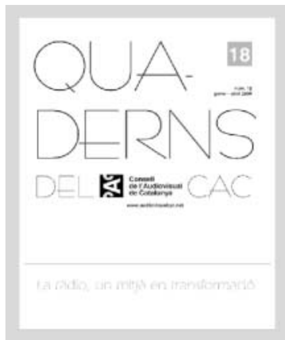
Quaderns del CAC, núm. 18

www.audiovisualcat.net/publicacions/quaderns17.html