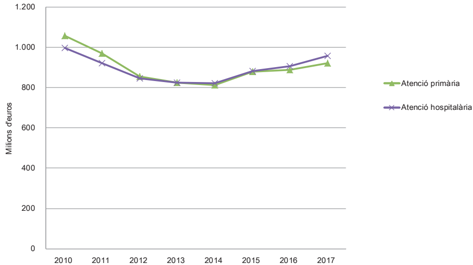
Figura 3.b. Evolució de la despesa meritada de capítol 1 (despeses de personal) de l'ICS 2010-17, per línia assistencial