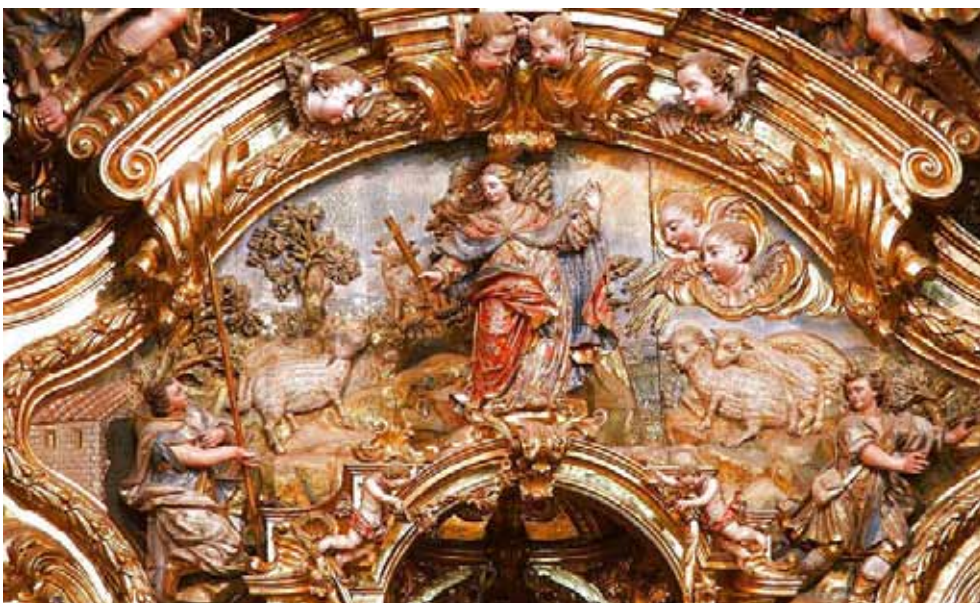
Retable barroc del Santuari del Miracle (Riner, Solsonès). Autora: Celsona.